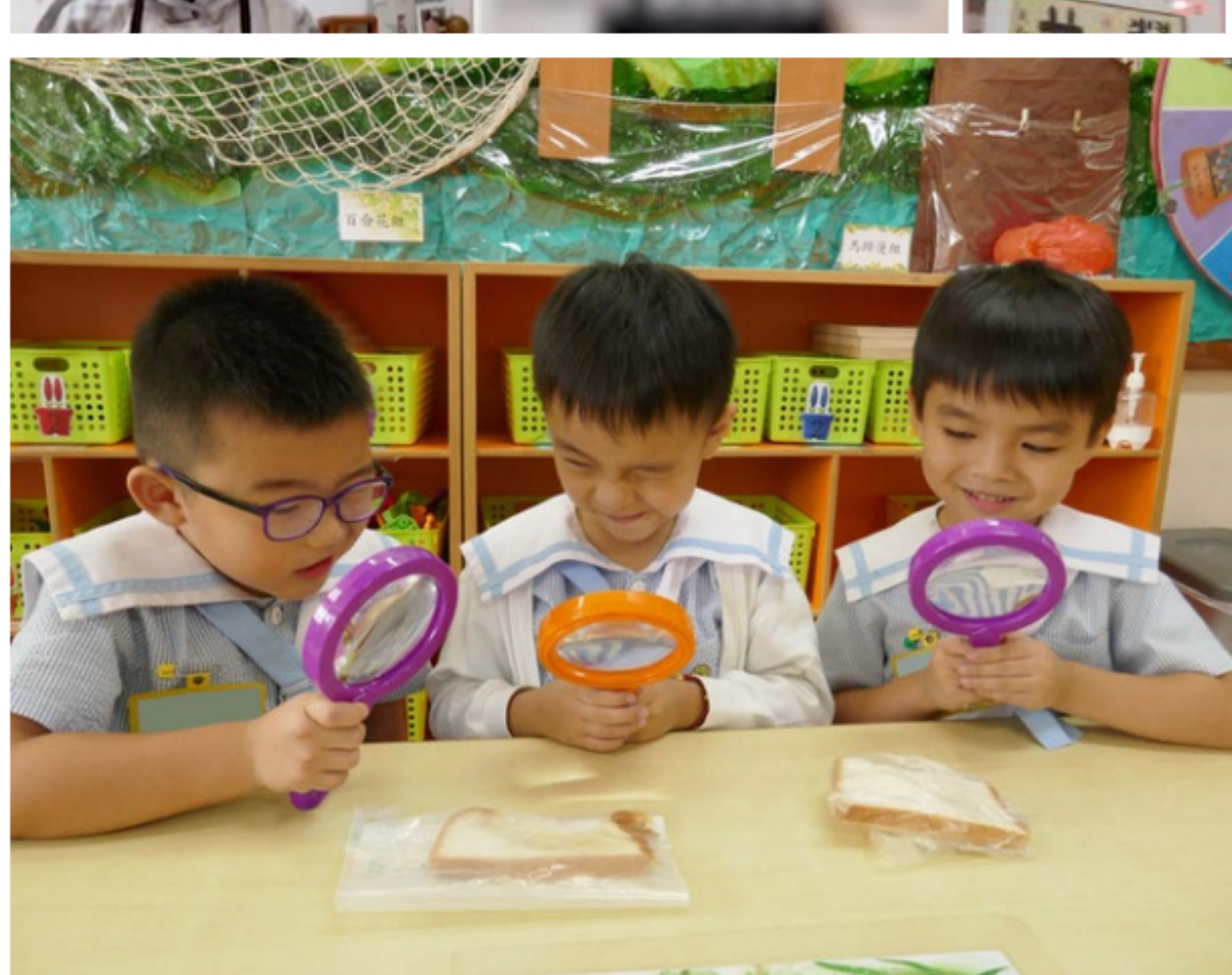
啟思幼稚園幼兒園資深校長認為Happy School能令孩子學得開心，同時也不會學得少：「我們不能單以大人的標準和角度，去量化孩子學習到的知識量，縱使孩子未能即時表達，但其實知識已被大腦所吸收，只要時機適合，就可以發揚所長。」

學習本是一件快樂的事，與其要強行於短時間之內要求孩子學到大量知識，倒不如讓他們摸索出一套適合自己的學習方法，孩子才能在通過自己努力後獲得知識而感受到快樂，並願意以此方法繼續學習。校長強調，幼兒教育最重要的是適齡、適度和適量，別急於學習之後的課程，否則如同「拔苗助長」：「授人以魚，不如授人以漁。家長應避免過度催谷子女，與其強迫孩子學習，不如嘗試深入了解子女，與他們一起找到適合自己的學習方法更為重要。例如在小學低年級時強迫孩子背好多生字，可能會幫孩子在默書時拿到高分，但當子女慢慢長大，有了自己的想法和見解後，就未必願意再以死記硬背的方式學習，同時也因為找不到學習的樂趣而不再喜歡學習新知識。因此培養孩子擁有好的學習習慣，遠比只著眼於測驗考試卷上的100分來得更重要。」