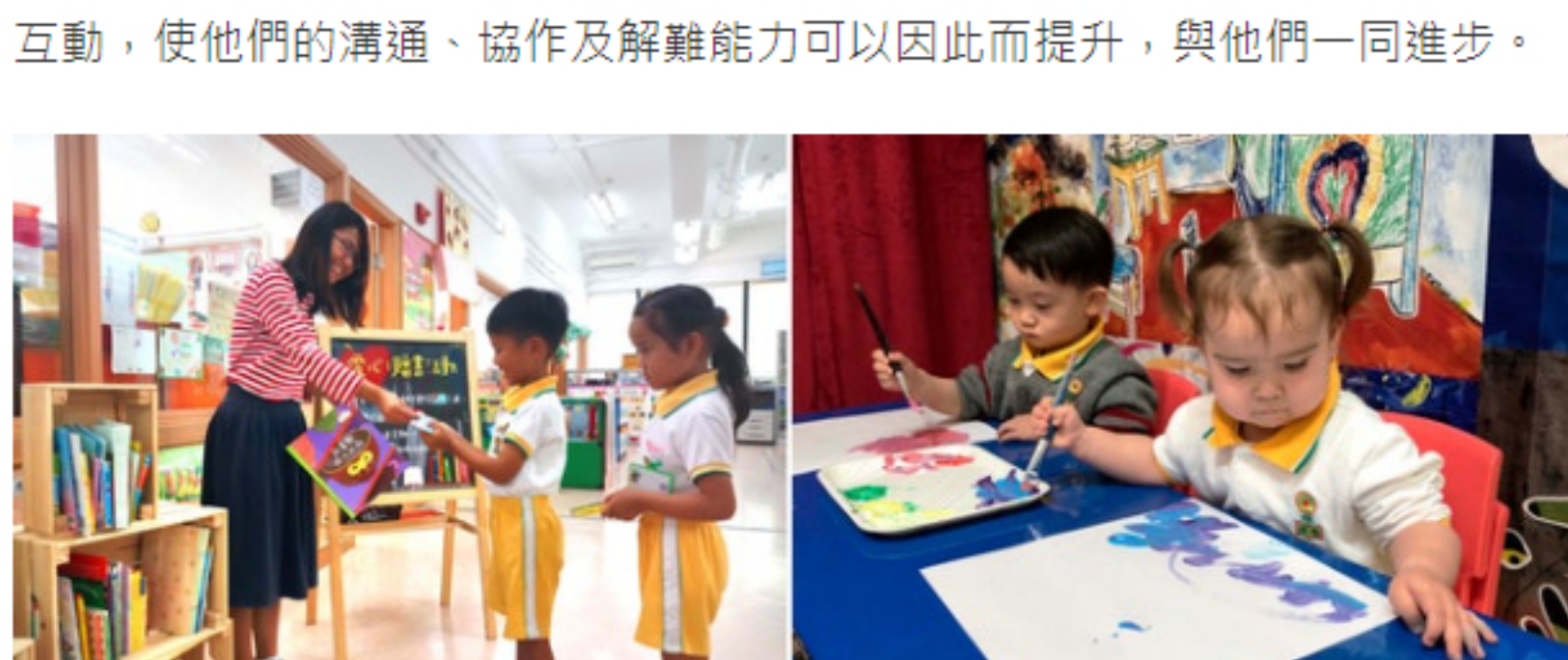
活動教學可激發孩子的創意，激發潛能。

「SMART」具備五個小貼士，S代表Stimulation（啟發思維）、M代表Message（正向教育）、A代表Artistic（創意藝術）、R代表Reading（閱讀）、T代表Time（親子時間）。第一，讓孩子有發揮的空間，自由選擇想嘗試的活動，在開心的學習環境下，啟發學習興趣。第二，保持禮貌、關愛他人等正向價值觀，家長可從小透過相處，邊灌輸、邊身教，同時也要懂得尊重和接納子女的意見，多聆聽他們的需要，讓他們感到被理解和鼓勵。第三，除了讀書之外，家長亦可讓子女多參與藝術、音樂等課程，讓他們擴闊眼界、發揮創意，探索自己真正喜歡的興趣。同時可從旁觀察，多些與子女互動，使他們的溝通、協作及解難能力可以因此而提升，與他們一同進步。