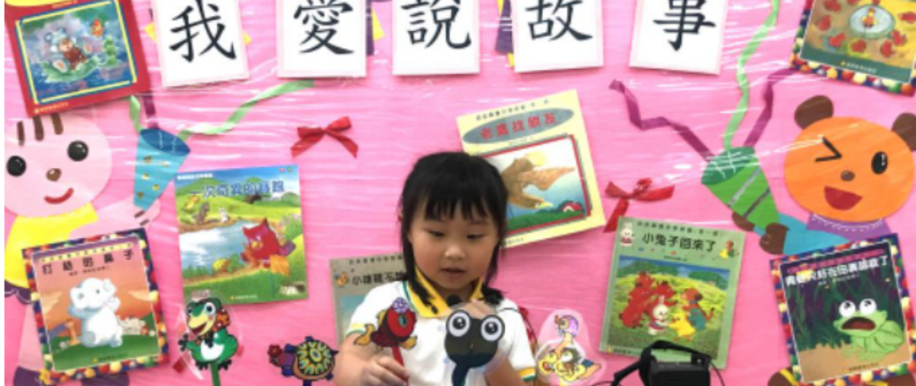
學生透過閱讀可提升語文能力。

歐校長則表示孩子會被圖書的外形吸引，然後嘗試了解書本的內容，過程中可能會主動發問，有助他們與人溝通和連結社會。啟思除了鼓勵學生多閱讀，更會給予他們表達的機會，學校舉辦的講故事活動，唱遊和話劇表演等延展活動，由單向讀書到互動，可以讓學生吸收當中的內容後，與其他學生合作並表達出來，加強閱讀的功効。