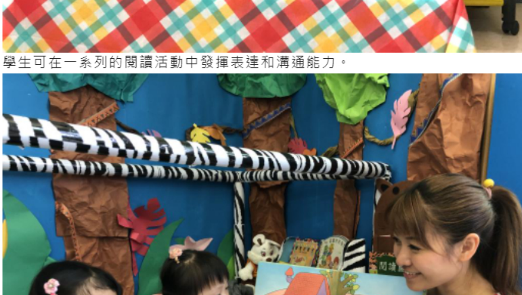
學生可在一系列的閱讀活動中發揮表達和溝通能力。