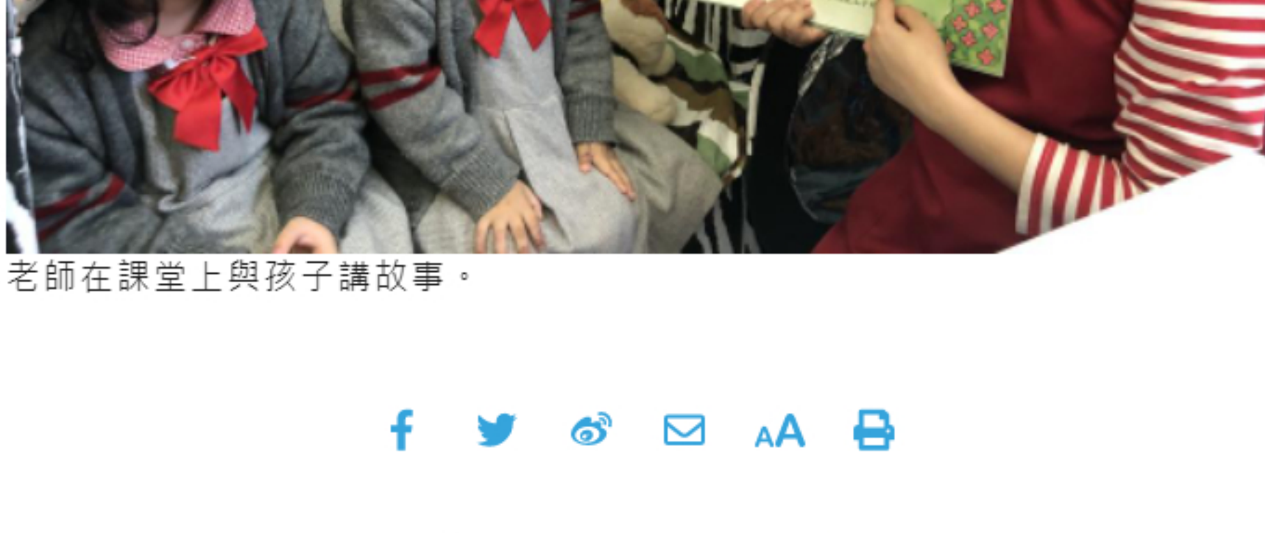
老師在課堂上與孩子講故事。