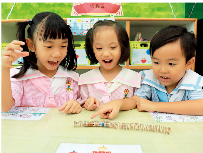
讓小朋友愉快學習是啟思最大特色。