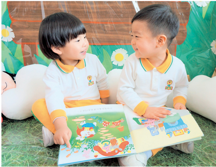
啟思着重學生在語文方面的發展，協助小朋友及早奠定穩固基礎。

正面的話，多讚賞並鼓勵，從而增強小朋友的自信心。藉此培育出有禮貌和正面的小朋友。」此外，馮校長亦指出，學校全面培育小朋友不同的品格，其中最重要的是愛心的培養。「引導小朋友發自內心的要對所有人都友善，正如校監一直的教導，就是要老師表現出他們的愛心，這樣，小朋友耳濡目染下會知道原來對別人有禮、思想正面，很多時可從內而外表現出來。」