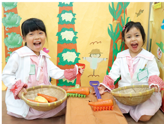
遊戲中學學習，讓小朋友投入其中，從而加強學習動機。