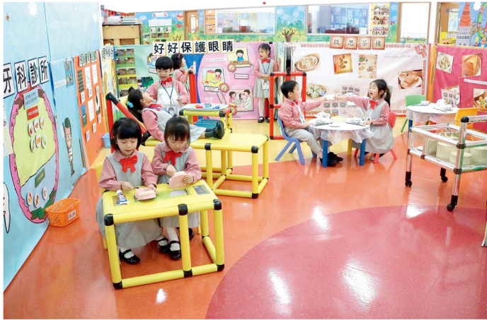
校園裏有不同的學習區域，老師期望小朋友都能活學活用。