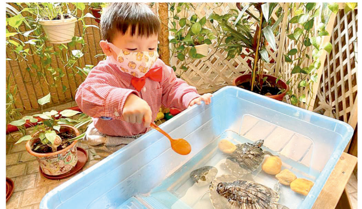
校園裏飼養了一些小動物，透過牠們讓小朋友明白生命。