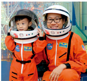
透過舉辦不同的活動，加深家長與學校之間的連繫。

此外，學校也有安排視光師教導家長悉心留意小朋友有否懶惰眼或近視。「疫情期間透過這些講座做過一些測試，結果發現有些小朋友真的有近視和懶惰眼的情況，這些都是家長之前並沒有察覺得到的。」此外，馮校長表示，學校也有安排小朋友參與港大舉辦的牙齒保護計劃；以及足部檢查計劃，了解一下小朋友有否扁平足問題。「希望藉此幫助家長關顧孩子由頭到腳的身體狀態。學校同時也會關心他們的健康心理狀況，安排大學教授到校為家長舉辦兒童情緒講座，讓家長對自己的孩子有更好的認識。」