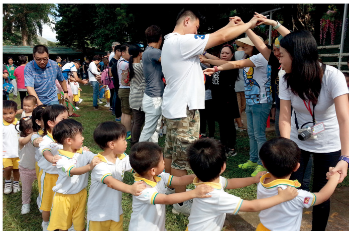
學校設有家教會，讓老師和家長之間有更佳的溝通。