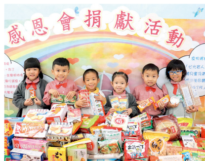
不時舉辦品德培養活動，從中教導小朋友付出及看到別人的需要。

「3至6歲是小朋友人生最初的一個階段，他們的價值觀很多時候都需要透過親身的體驗才慢慢形成。小朋友也很容易受外在事物影響，因此我們應該從小教導小朋友正確的價值觀和是非黑白的道理，作為長輩，我們更要以身作則，引導小朋友如何認識自己更多；如何與不同人相處，他們慢慢便會明白自己在社群中的定位，這對於他們長大後，在社會上的生存是很重要的。過程中，家長的參與不可少，我們的任何理念也需要與家長溝通，從而一起幫助小朋友進步。學校得到家長的認同，一起同行，這樣小朋友的得益才會最大。」