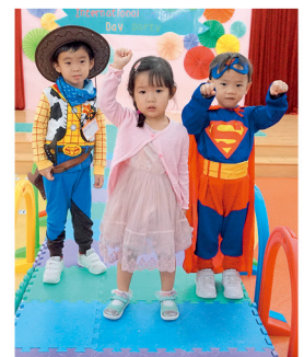
英語採用小班小組教學，令學習更見成效。