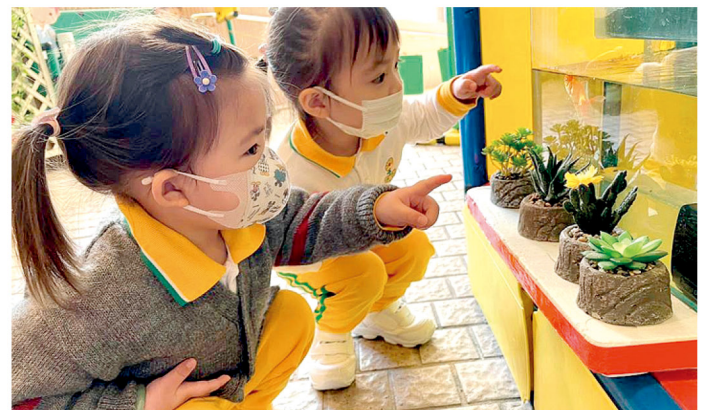
校園裏也栽種不少植物。