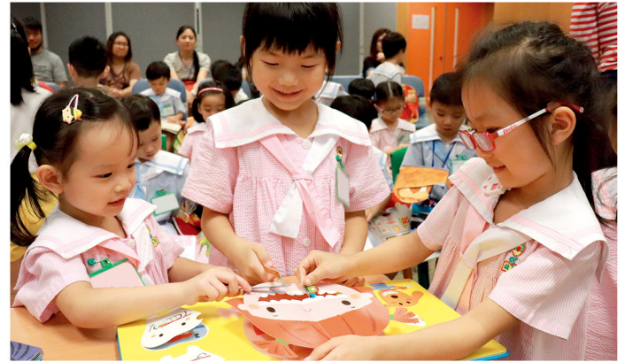
學校銳意推行全面的閱讀計劃，透過閱讀擴闊小朋友的眼光和世界。

望小動物，過程中可以培養小朋友的愛心。此外，小朋友有機會去餵魚，但如果每個小朋友都想餵魚，這時候他們便要學習如何跟別人合作。由此可見，學校無論在校舍的佈置、設計，以及老師跟小朋友的相處，都希望能將生命教育承傳下去。」