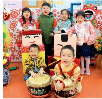
啟思致力培養小朋友在音體藝各方面的發展。

份如氫氣球般拉下來，簡易說明當中藝術技巧，令小朋友都可以做得到，這也是另一個層面培養他們的自信心。」