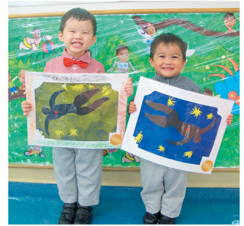
小朋友臨摹畫作，從中認識不同的藝術家，領略何謂美的欣賞。