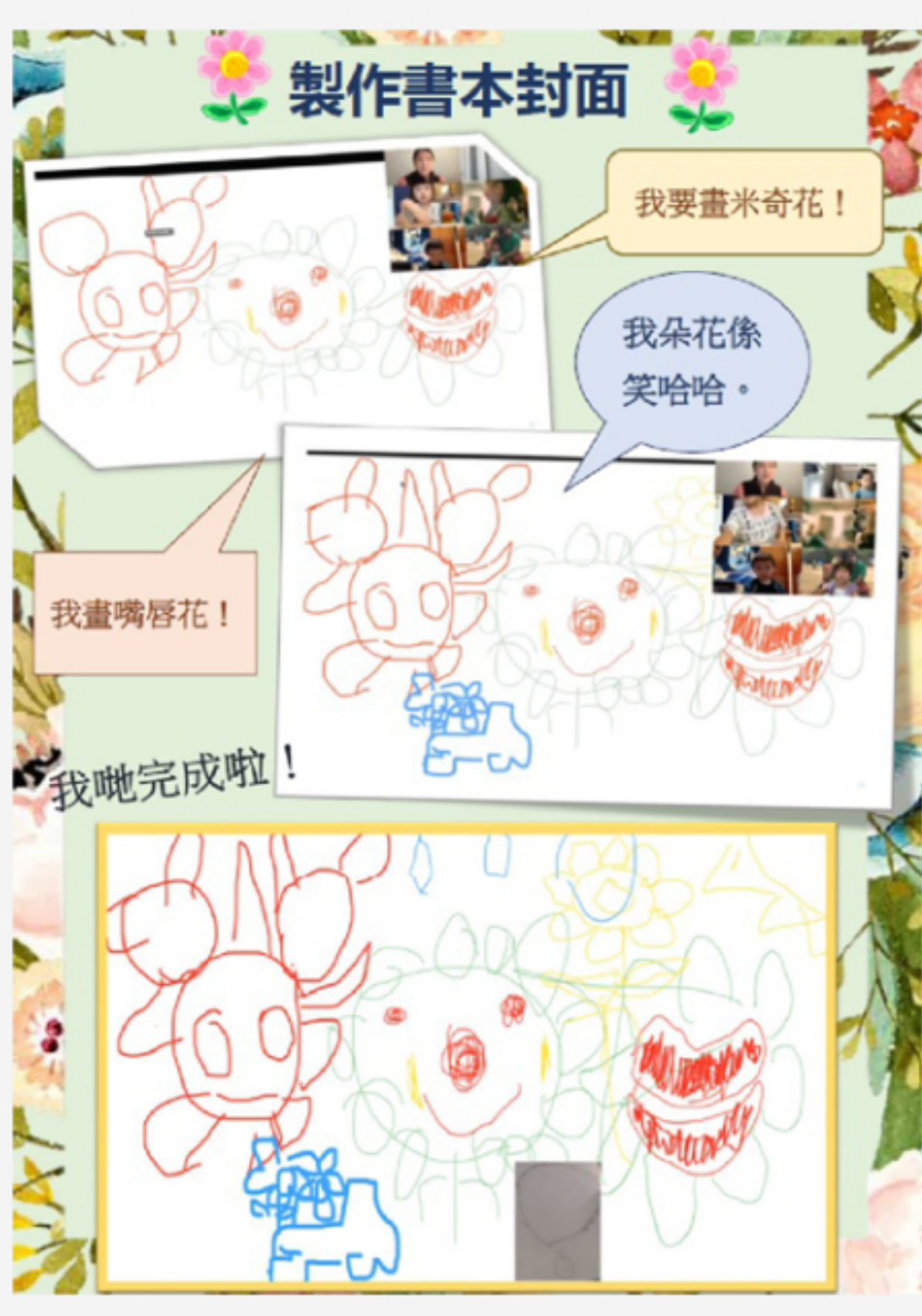
▲ 小朋友在開展「小方案研習」的過程中，分工合作製作花朵主題書本。