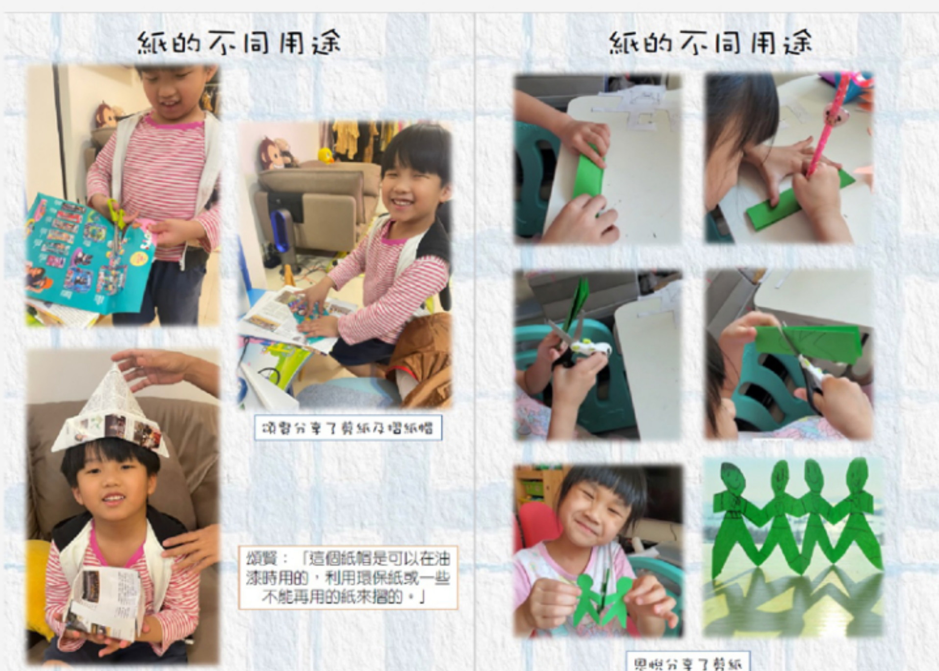
▲ 透過『紙』mini project，讓K3小朋友對摺紙產生興趣，摺出各具特色的紙製品。

為提升學習興趣，啟思很早已經透過每學年進行的「方案研習」活動，鼓勵他們自主學習。在這疫情反覆的兩年下，幼稚園為配合防疫措施，不時須暫停面授課堂，改為從網上平台授課。有見及此，啟思試行全新的活動學習模式—「小方案研習」，將孩子感興趣的學習主題與互動討論模式結合，令他們即使在家接受網上授課，既可學到知識，也感受到學習的趣味與吸引力。